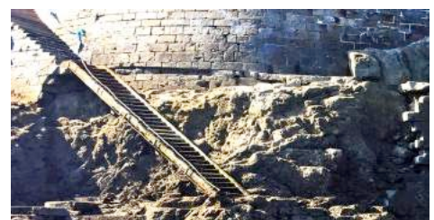
Marche de plus d'une tonne soulevée et emportée, dallage arraché, passerelle déformée.....